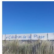
RESTAURANT DE PLAGE